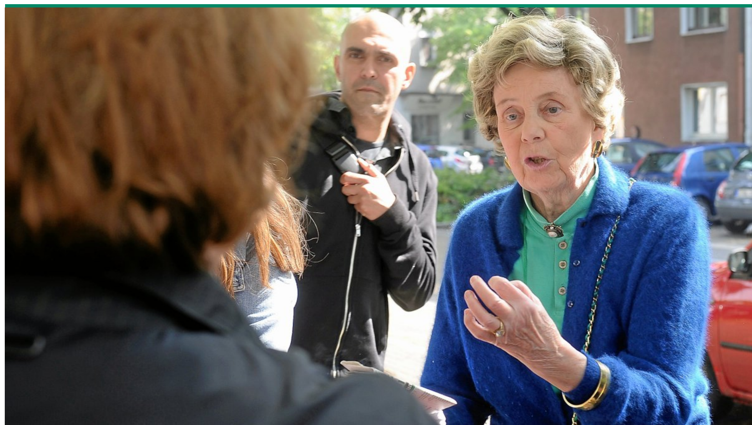
Immer streitbar: Die Essener Theologin Uta Ranke-Heinemann, hier bei einer Diskussion über die mögliche Umbenennung der Von-Seeckt-Straße.

ESSEN-SÜDWERTEL. Eine Grünfläche im Moltkeviertel soll den Namen der Theologin Uta Ranke-Heinemann tragen. Warum die Benennung frühestens im März möglich ist.